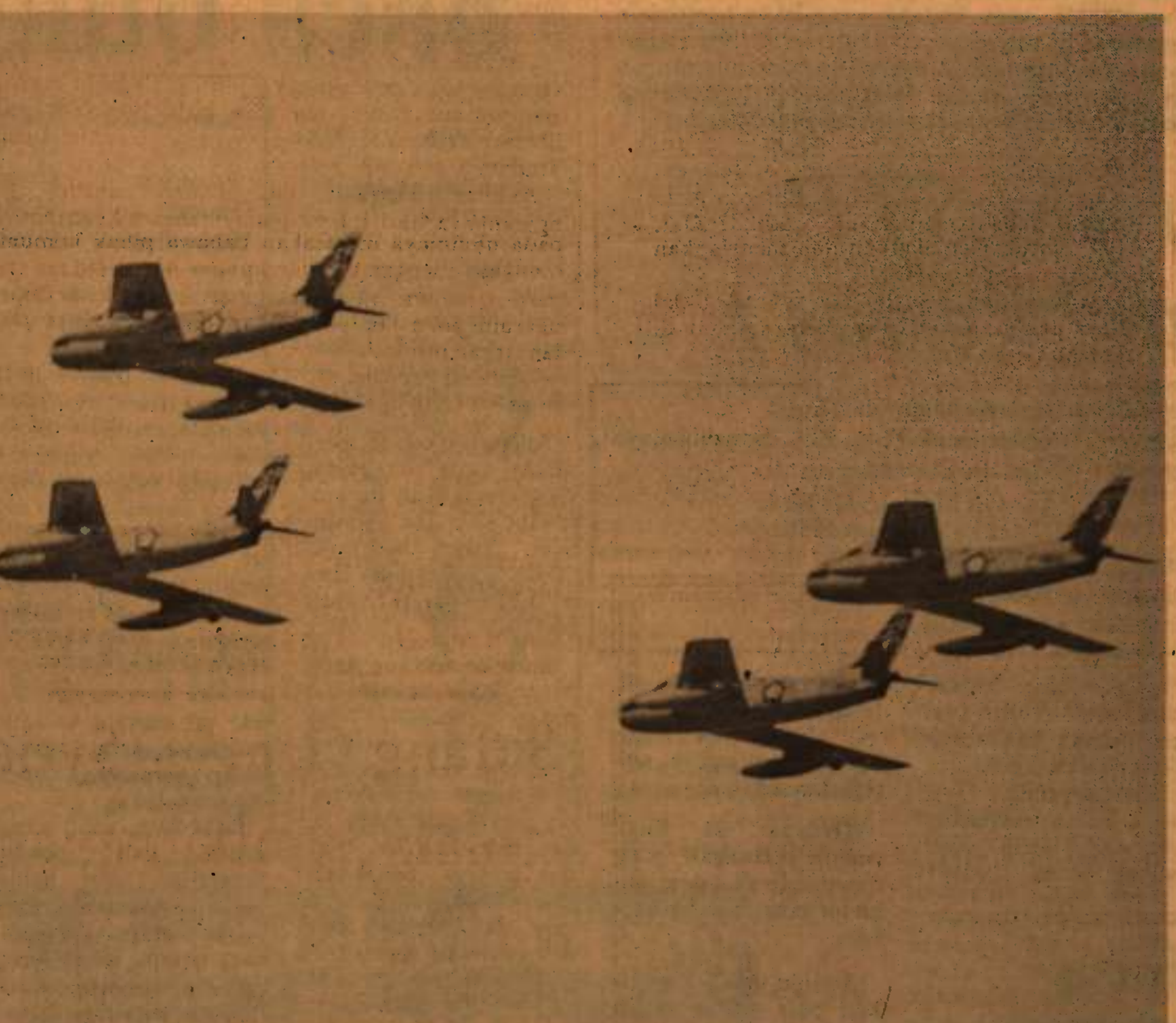
EMPAT buah kapal terbang Sabre kepunyaan TNI-AU membuat penerbangan "Arrow Head" sebelum menembak target di bumi.

Latihan menembak target dari udara itu dilakukan di Kampung Keriang, kira-kira 20 batu dari sini. Di akhir latihan hari keempat Helang