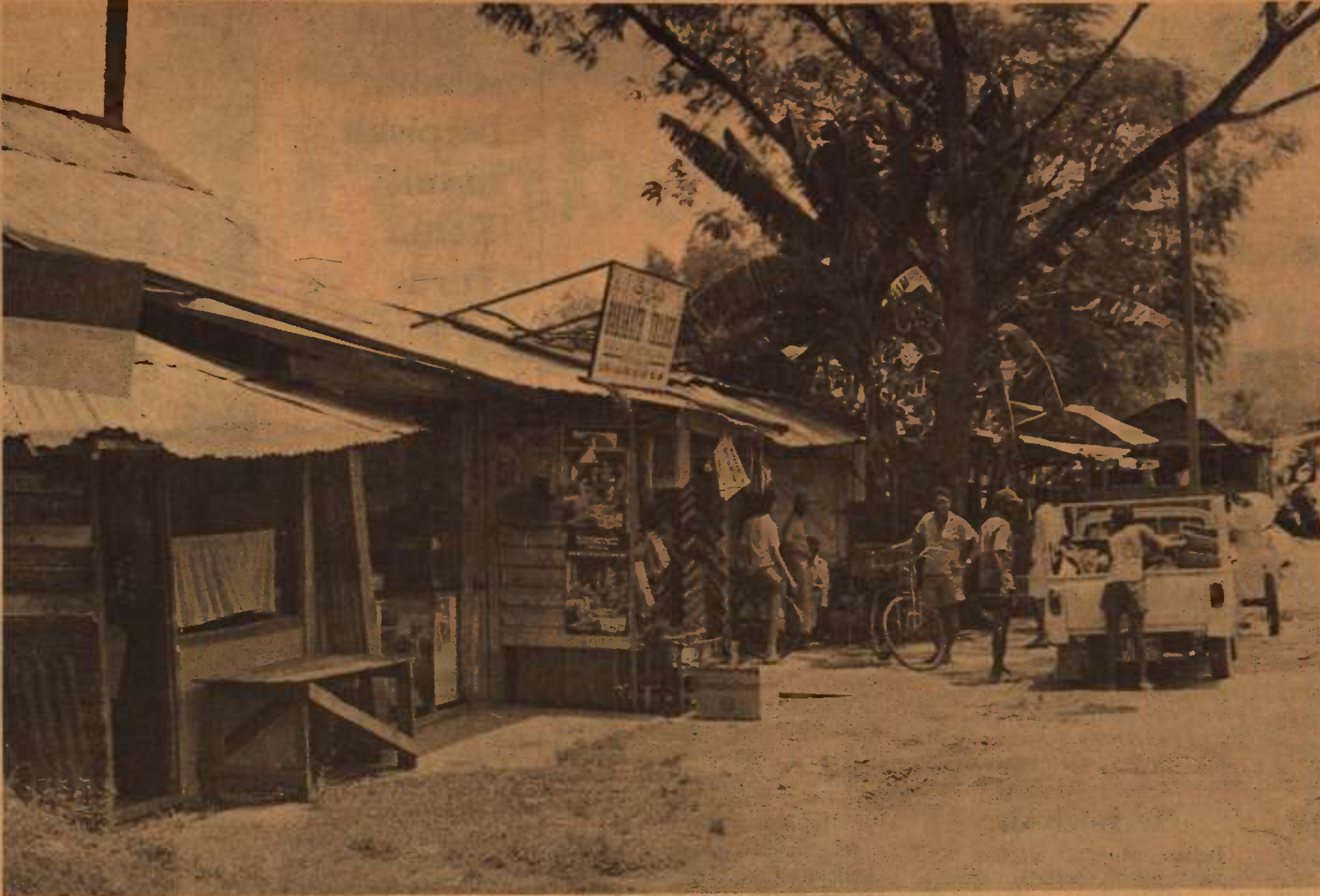
INILAH di antara kedai-kedai yang termasuk dalam kawasan tanah angkatan tentera di Wardieburn Kem yang diberi notis pindah dari kawasan tersebut.

Beliau yakin projek pembangunan kampung kedua di Mukim Raja itu akan mendapat kejayaan yang besar dan memberi kehidupan baru yang lebih lumayan di rancangan tanah yang akan dimajukan oleh FELCRA itu.