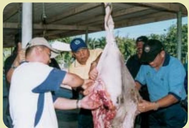
Pengerusi dan Ketua Pengarah RISDA melapah lembu korban

Pada keesokan harinya peserta diberi peluang untuk sama-sama menyertai ibadah korban. Aktiviti yang terlibat termasuklah menyembelih, melapah dan membahagi daging korban kepada fakir miskin. Sesungguhnya pengalaman manis di Kampung Parit Sapran akan tersemat dalam sanubari peserta sampai bila-bila.