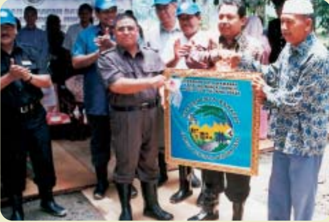
Penyampaian Logo GDW kepada Ketua Kampung Sg. Jernih

G erakan Daya Wawasan adalah merupakan suatu gerakan pembangunan kampung atau desa yang melibatkan pembangunan sosial dan ekonomi masyarakat luar bandar. Pekebun kecil perlu menerima perubahan bagi menjadikan desa maju, menarik dan menguntungkan.