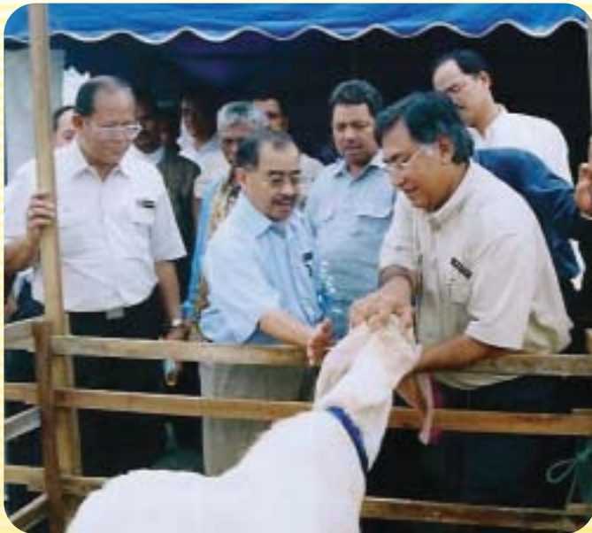
Y.B. Dato' Sri Abdul Aziz Shamsuddin melawat Gerai Pameran Ternakan Kambing Jamnapari yang diusahakan oleh Smallholders Wood Industries (Johor) Sdn. Bhd. di Kg. Gembut, Kota Tinggi, Johor