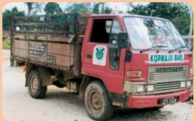
Sebuah daripada dua unit lori kepunyaan En. Jumaat Kosnan berkapasiti 1 1/2 tan-tertera lambang KOPMAJU Berhad - Perkongsian pintar bersama Koperasi Pekebun Kecil Daerah Muar Berhad - Mengangkut getah beku ke kilang dan BTB - RSPSB Muar / KOPMAJU