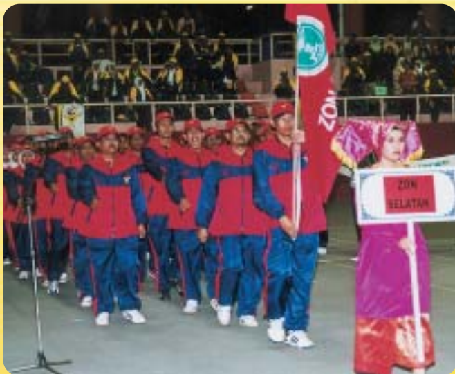
Pasukan Zon Selatan sedang berarak masuk ke Stadium Tertutup Centre Court Paroi, Seremban, Negeri Sembilan sempena Pesta Sukan Kebangsaan RISDA Kali ke XIII