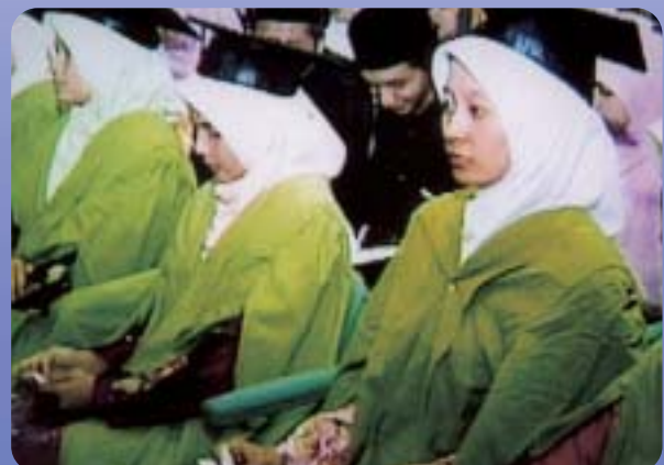
Para graduan sedang mendengar ucapan

Bagi memeriahkan suasana, Ekspo Pertanian RISDA diadakan selama dua hari mulai 6 hingga 7 Disember dari 9.00 pagi hingga 9.00 malam bertempat di belakang Ibu Pejabat RISDA. Pelbagai produk pertanian, kraftangan bunga daun getah hasil keluaran pekebun kecil dan lain-lain promosi turut diadakan.