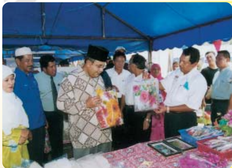
Dato' Seri Syed Hamid Albar dan Dato' Dr. Awang Adek Hussin melawat gerai pameran RISDA sempena Hari Pelanggan KKLW di Kg. Mawai Baru, Kota Tinggi, Johor