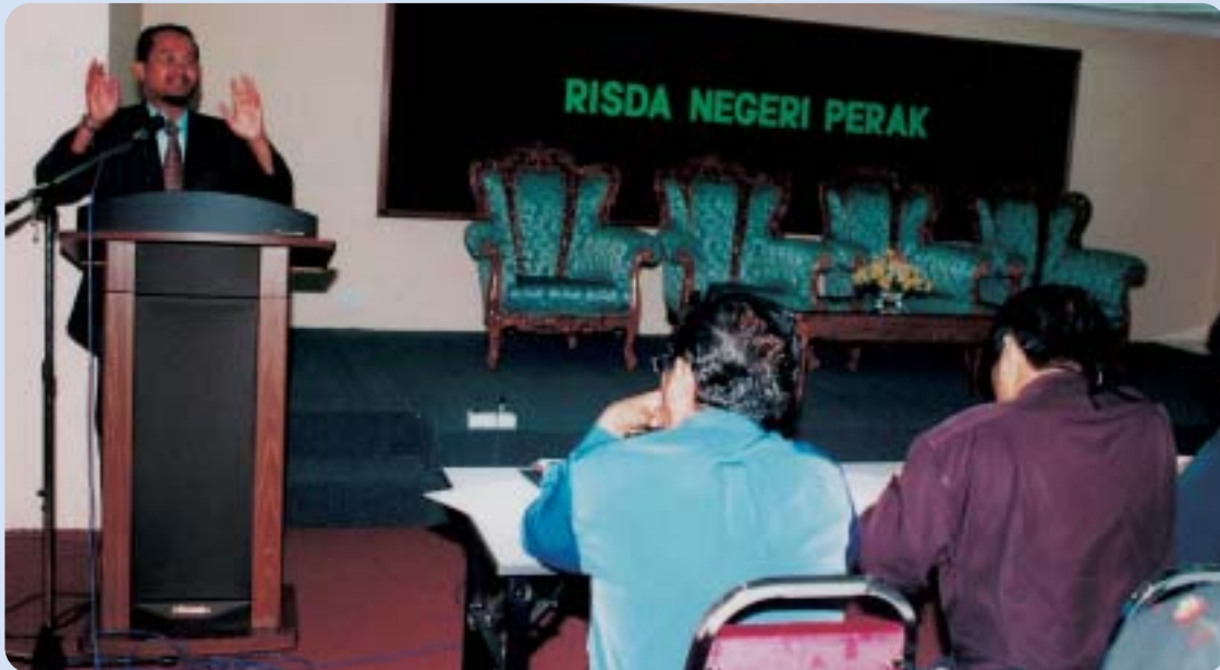
Pegawai Bahagian Harta Baitulmal Perak memberi penerangan

Koperasi Pekebun Kecil seharusnya tidak bergantung kepada projek pemberian RISDA sahaja untuk menjana pendapatan, sebaliknya perlu menerokai peluang-peluang perniagaan yang lain sama ada dengan agensi-agensi kerajaan yang lain atau sektor swasta.