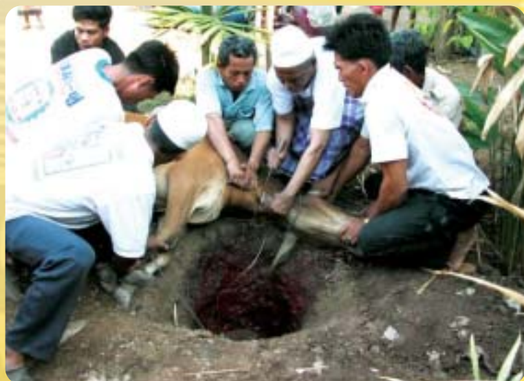
Badan Agama Islam Ibu Pejabat RISDA turut menyertai ibadah korban di Kampuchea