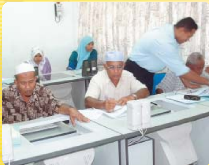
Warga Emas yang mengikuti Kursus ICT Desa di Kolej Risda Ayer Pa'Abas, Melaka