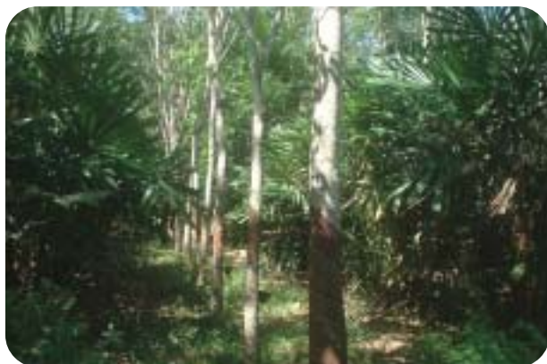
Pokok palas yang ditanam di antara lorong pokok getah

Suatu ketika dulu ketupat palas hanya dihidang pada hari raya Aidilfitri dan Aidiladha sahaja. Tetapi kini ketupat palas telah menjadi hidangan harian orang utara. Justeru itu permintaan kepada daun palas menjadi tinggi. Senario ini menjadi satu peluang yang berharga kepada pekebun kecil di kawasan utara untuk menambah pendapatan keluarga.