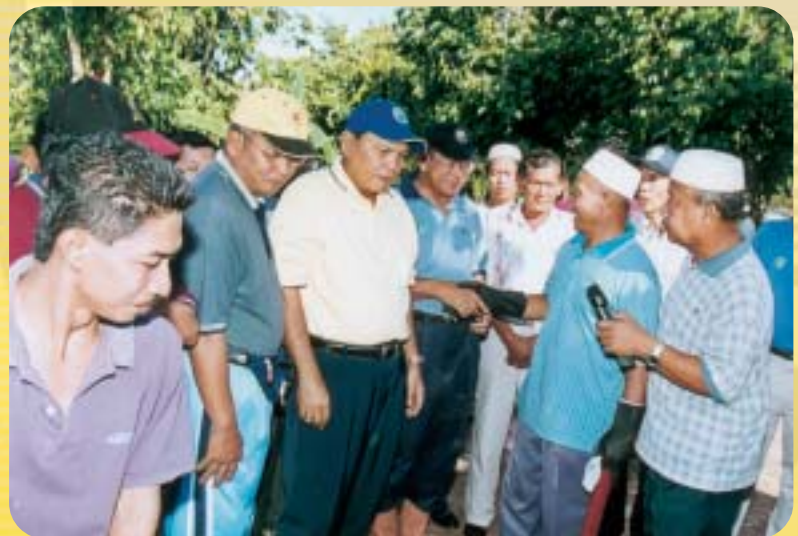
Ketua Pengarah RISDA turut melakukan akad sebelum melaksanakan ibadat korban di Kg. Parit Sapan, Pontian, Johor