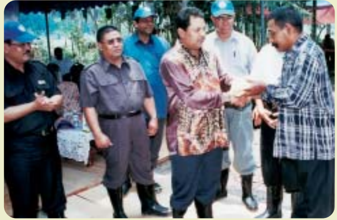
Peserta Projek Kraftangan menerima bantuan daripada Y.B. Dato' Dr. Awang Adek Hussin

Di majlis tersebut YB Dato' Dr. Awang Adek menyerahkan logo GDW sebagai tanda penghargaan kepada penduduk tempatan.