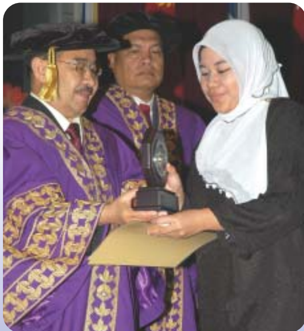
Y.B. Dato' Sri Abdul Aziz Shamsuddin menyampaikan sijil kepada salah seorang graduan

Hari ini dalam sejarah bertarih 7 Disember 2004 (Selasa) Kolej RISDA telah mengadakan Majlis Konvokesyen Kali Ke 3 bertempat di Auditorium Sultan Ahmad Shah, Ibu Pejabat, RISDA, Kuala Lumpur. Majlis bermula 8.00 pagi dengan perarakan Graduan dan Ahli Akademik masuk ke Auditorium. Pengisytiharan dan ucapan Konvokesyen kali ke 3 Kolej RISDA ini telah disempurnakan oleh Y.B. Dato' Sri Abdul Aziz Shamsudin, Menteri Kemajuan Luar Bandar dan Wilayah (KKLW).