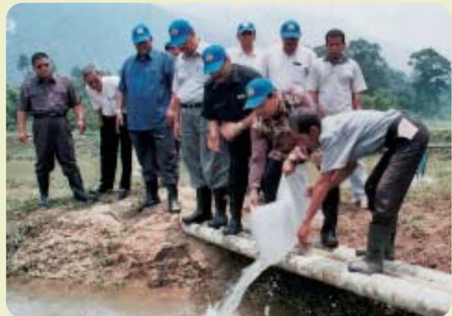
Y.B. Dato' Dr. Awang Adek melepaskan benih udang galah

Beliau turut menyampaikan bantuan kepada peserta projek ternakan udang galah sistem kolam, projek kraftangan dan melakukan upacara pecah tanah serta pelepasan benih udang di kolam berhampiran.