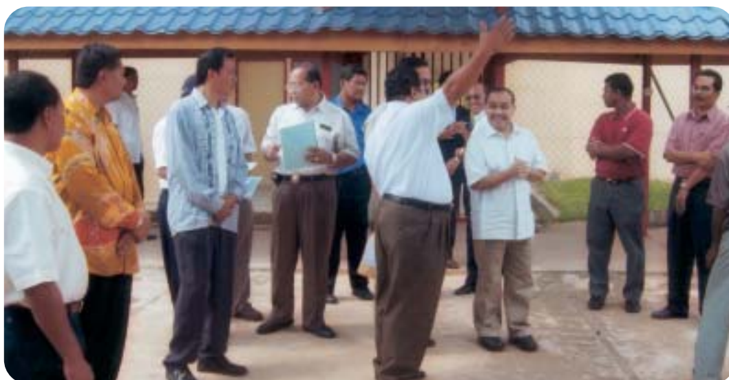
Y.B. Dato' Sri Abdul Aziz Shamsuddin dan rombongan meninjau kawasan Sekolah Kebangsaan Pos Lanai, Pantos.

Pada 21 November 2004 yang lalu, Y.B. Dato' Sri Abdul Aziz Shamsuddin, Menteri Kemajuan Luar Bandar dan Wilayah (KKLW) telah mengadakan lawatan kerja ke projek di bawah Program Pembangunan Bersepadu Desa Terpencil (PROSDET) di Kampung Pantos, Lipis, Pahang Darul Makmur. Dalam lawatan kerja itu, Y.B. Dato' Sri Abdul Aziz telah diberi taklimat mengenai peranan RISDA dalam pembangunan PROSDET yang disampaikan oleh Ketua Pengarah Risda.